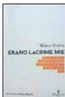
ERANO LACRIME MIE

MARCO STATZU EDIZIONI GRAPHE.IT pag. 65; euro 10