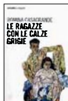
LE RAGAZZE CON LE CALZE GRIGIE

R. CASAGRANDE ARKADIA pag. 2015; euro 15