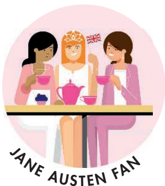
JANE AUSTEN FAN

Miss Austen, di Gill Hornby (Superbeat, € 18) Anni dopo la morte di Jane Austen, la sorella Cassandra torna in un luogo caro a entrambe, rivivendo tanti ricordi. Basato sulla loro corrispondenza, questo romanzo scritto dalla sorella di Nick Hornby ti fa vivere episodi della vita della scrittrice da un altro punto di vista. Nessuna fan di Jane Austen può farselo scappare.