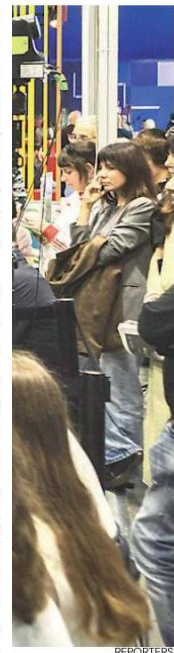
La scrittrice Zadie Smith ieri ospite dello stand della Stampa al Salone del Libro, intervistata da Simonetta Sciandivasci

capacità di provare solidarietà per chi ci è più prossimo?